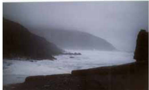
Sturm am Coumeenole Beach