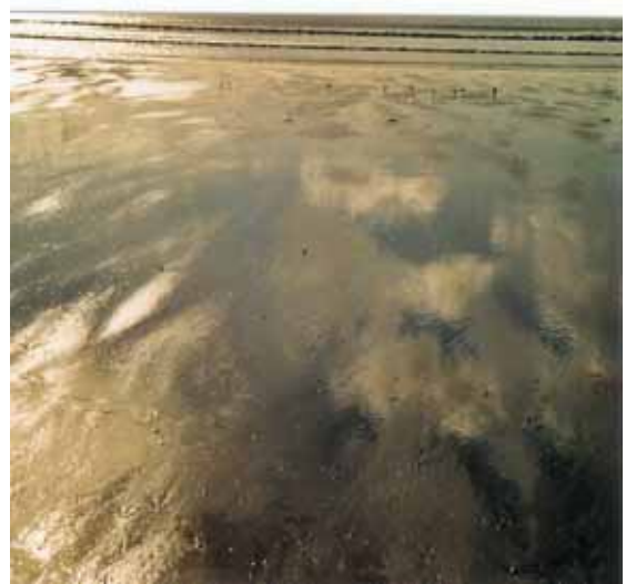
Das Ende der Welt