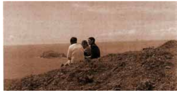
Ring of Kerry