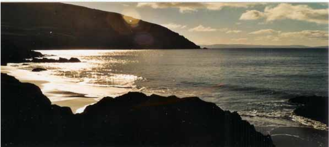
Die Flut kommt am Coumeenole Beach